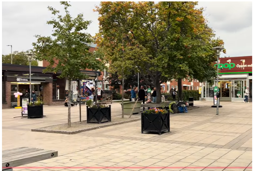
Äldre foto från Örnberg. Den nu nedrivna anslagstavlan kommer att sättas tillbaka.

Förvaltningen konstaterar att den anslagstavla som ska sitta i Örnbergs centrum har rivits ned. Den kommer nu att sättas tillbaka på torget.